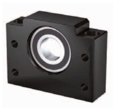
(1) Těleso domečku, (2) Radiální ložisko, (3) Pojistný kroužek